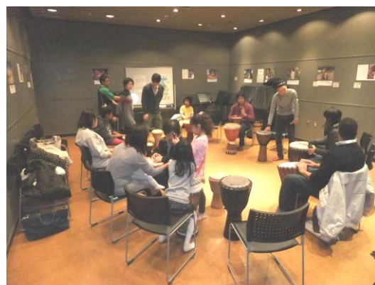
ジャンベ (アフリカ太鼓) ワークショップ