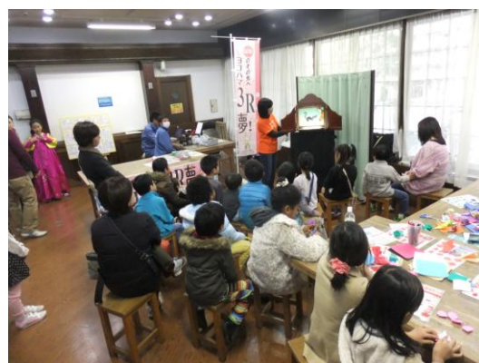
紙芝居、折り紙コーナー