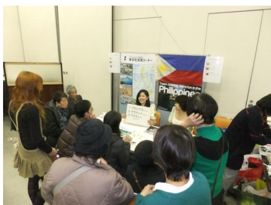
多文化交流コーナー