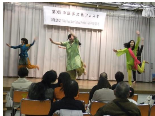
ステージパフォーマンス