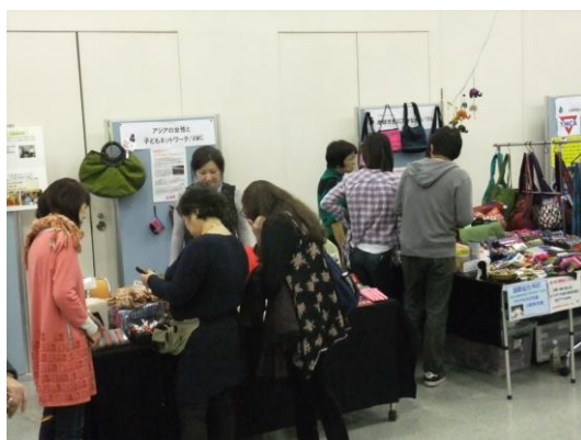
世界のお買い物コーナー